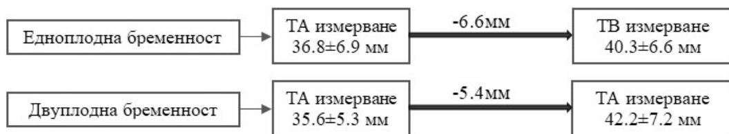
Фиг. 1 Съпоставяне на ТА ДМШ при едноплодни и двуплодни бременности с ТВ УЗ измерване ДМШ. (P01.01: Transabdominal cervical length measurements above 35mm exclude short cervix in both twin and singleton pregnancies, 2017)

Трансабдоминалното (ТА) измерване може да се използва като първичен скрининг, но при ДМШ \leq 35 мм или когато измерването не е оптимално, е задължително потвърждение с ТВ УЗИ. (ISUOG, 2022; FMF protocol). [LOE 2A – Coh MA].